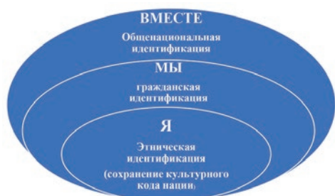
Рис. 3. Модель идентификационных процессов, осуществляемых в рамках национального воспитания

Исходя из вышеобозначенных позиций разработана Модель идентификационных процессов, осуществляемых в рамках национального воспитания от этнической и гражданской идентификации к общенациональной (рис. 3).