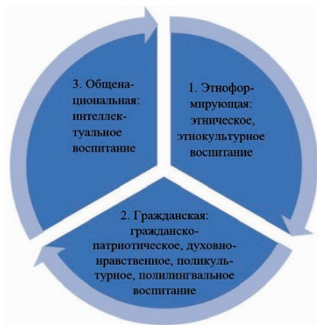
Рис. 2. Содержание структурных компонентов новой Модели национального воспитания учащейся молодежи Казахстана

данско-патриотическому, духовно-нравственному, поликультурному, полилингвальному воспитанию, ориентированному на межкультурное и межконфессиональное взаимодействие и основанному на общечеловеческих ценностях;