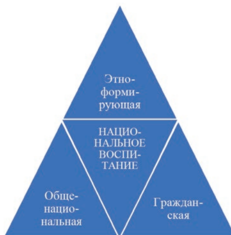
Рис. 1. Модель национального воспитания

2) в рамках гражданской составляющей приоритет отдается гражд-